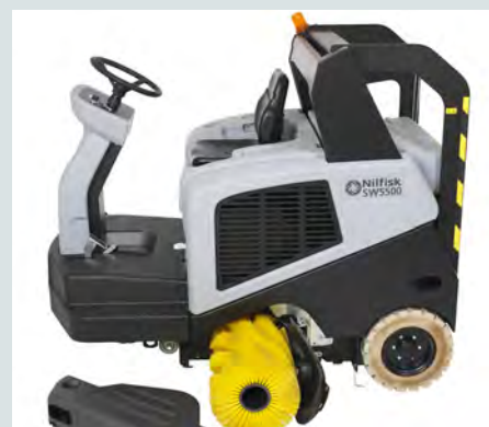
Snabbt och enkelt byte av de viktigaste komponenterna underlättar i den dagliga driften och minskar driftstopp.