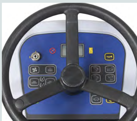
Manöverpanel med ikoner och en modern display ger användarvänlighet i världsklass.