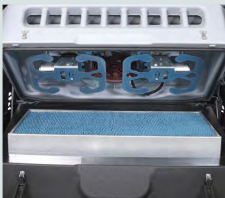
Den tidsinställda multifrekvens-filterskakaren säkerställer effektiv rengöring av filtret.