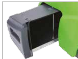
STOR FRÄMRE SMUTSBEHÅLLARE