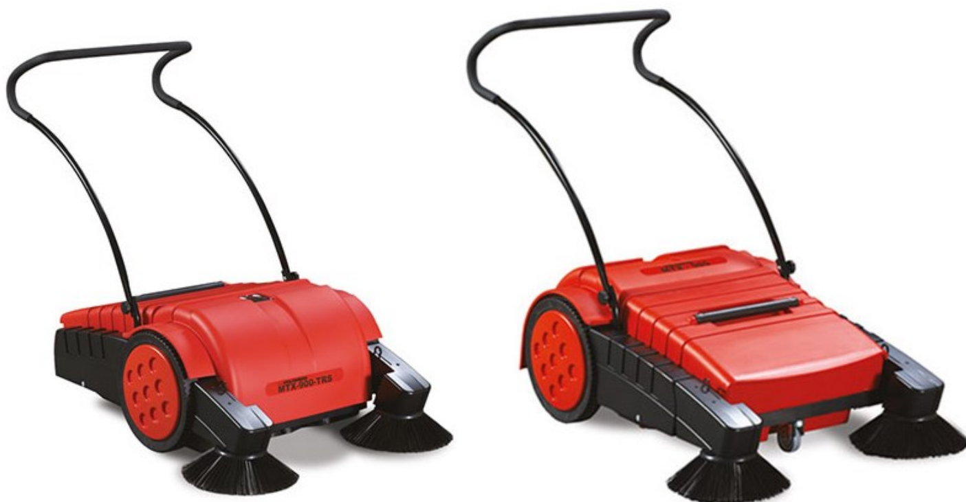
MTX 900 MTX 900 B MTX 900 B TRS MTX 900 TRS MTX 900 V MTX 900 V TRS MTX 900 VB MTX 900 VB TRS

MTX 900 är en robust sopmaskin för olika krävande användningsområden, utrustad med den välkända överkast tekniken (även direktsopare). Den smidiga maskinen kan användas på parkeringsplatsen, lagret mm. Ingångsmodellen MTX 900, rengör ytor manuellt, och toppmodellen, MTX 900 VB, är den optimala enheten med batteri, dammsug och borstdrift för alla ytor inomhus och utomhus, även på mattor. Flexibilitet och komfort är modulsystemets grundprinciper.